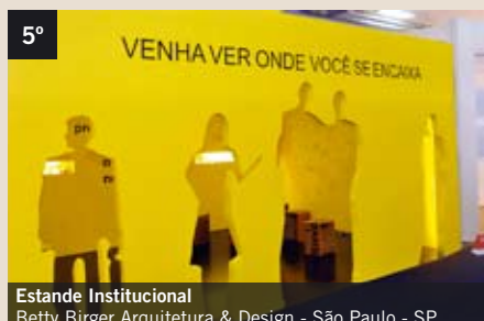
5° Estande Institucional Betty Birger Arquitetura & Design - São Paulo - SP