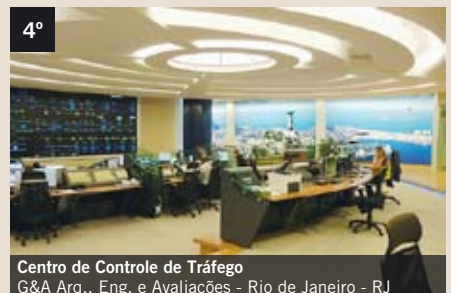
4° Centro de Controle de Tráfego G&A Arq., Eng. e Avaliações - Rio de Janeiro - RJ