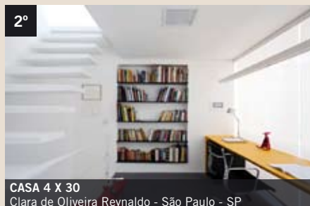
2° CASA 4 X 30 Clara de Oliveira Reynaldo - São Paulo - SP