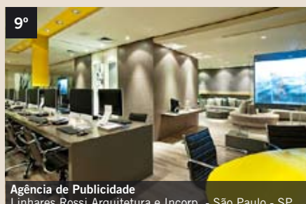
9° Agência de Publicidade Linhares Rossi Arquitetura e Incorp. - São Paulo - SP